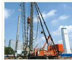
※2014年3月 Hyper-ストリート工法における適用地盤拡大

当社の工事部門は、主にコンクリートパイルの打設工事を行っています。以前は、ハンマーを使って杭を打撃して沈設していましたが、騒音や振動対策のため、現在では、地盤を掘削して杭を沈設する方法へと変化しています。引き続き、低公害・高品質な施工方法の開発に注力していきます。