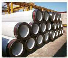
※2015年10月 ONA123パイルシリーズ認定取得 ※2015年11月 新工場 NC九州 九州工場稼働

日本では表層が堅固な地盤が少なく、ビルや橋梁の重さを支えるために、建築物の基礎にパイル（杭）がよく用いられています。当社はこの業界で後発でしたが、ポールの技術を活かして、従来製品より高強度な製品開発に成功し、以来業界内で重要な地位を確立しました。学校、中層マンションなどの重量のある建築物に使用されています。