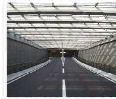
※2015年11月 新工場 NCセグメント 関西工場稼働

コンクリート製品の総合メーカーとして、また当社の経営理念「都市空間づくり」に則し、PC-壁体など各種プレキャスト製品を生産しています。製品の主な用途は、擁壁、河川護岸、遮音壁、地中構造物などがあります。また、UFC（超高強度繊維補強コンクリート）を用いて、耐久性に優れる製品の製造も行っています。