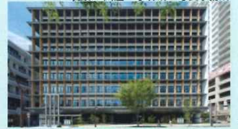
カーボンニュートラル賞 近畿支部 関与した設備士：生島 宏之、大山 直樹(日本設計)