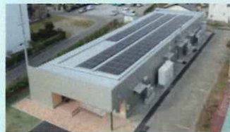
カーボンニュートラル賞 北信越支部 奨励賞 関与した設備士：鳥井 清司 (三友ファシリティーズデザイン)