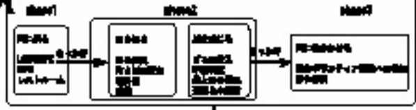
自生活での現場写真

この計画は、町中の賑わいを生かす人々の憩いの場を創出する。この計画は、人々の憩いの場を創出する。この計画は、人々の憩いの場を創出する。この計画は、人々の憩いの場を創出する。