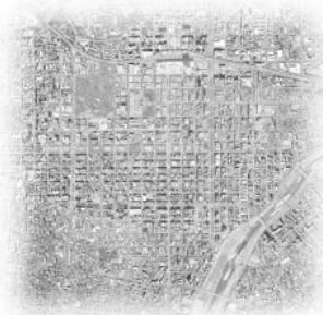
■ urban axis