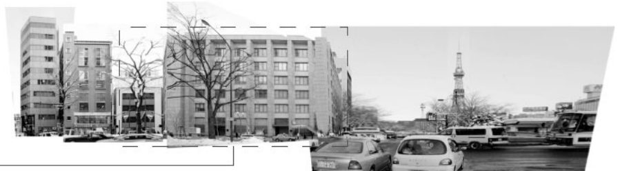
Project Site Elevation