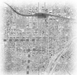
■ JR line ■ subway line ■ city tram line ● bus terminal