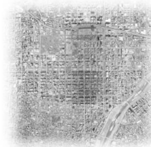
● commercial area ● business area ● residential area