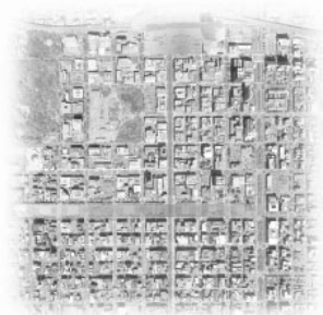
■ underground passage ■ new underground passage (now planning)