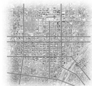
■ main traffic street