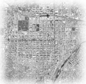
■ green area