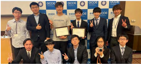
国際会議 IEEE GCCE2022での発表・受賞