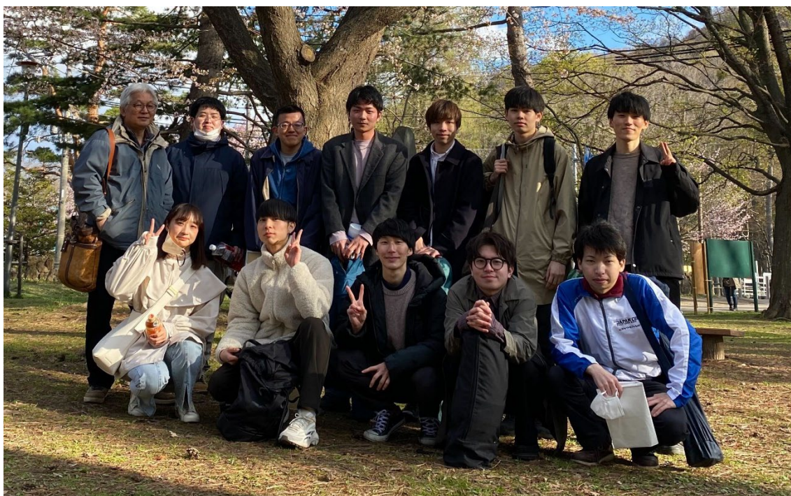
(2023. 4. 24 円山公園にて)

研究室の報告は随時ホームページでも公開しておりますのでお時間のある時にご覧ください。 https://prml.main.ist.hokudai.ac.jp