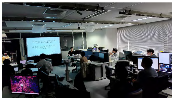
研究室での打ち合わせの様子(十分に間隔を取って実施しています)

研究室の現況については、web page ( https://iis-lab.ist.hokudai.ac.jp/ )等で発信しておりますので、機会がございましたらご笑覧いただきたく存じます。この数年間は卒業生のみなさまとの交流が難しくなっていますが、2023年度は通常状態に戻ることを期待しています。ご来札の機会も増えるかと存じますので、是非お気軽に研究室にお立ち寄りください。その際は、現メンバーへの叱咤激励をいただけると大変有難く存じます。みなさまの一層のご活躍、ご健勝を祈念いたしますとともに、今後も変わらぬご指導ご鞭撻のほど、何卒宜しくお願い申し上げます。