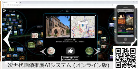
次世代画像推薦AIシステム (オンライン版)