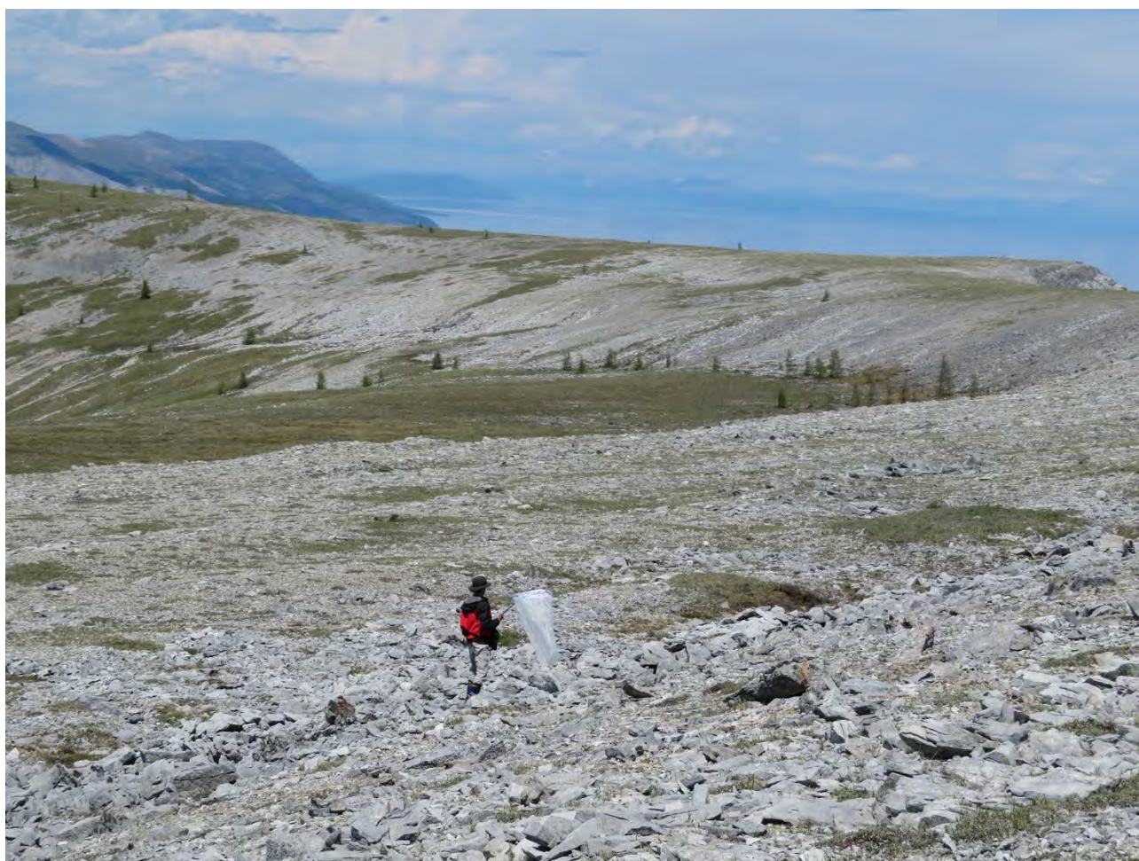
写真：モンゴルでのサンプル（蝶）採集の様子

2023（令和5）年度は、学部5名、修士課程5名の計10名の学生が在籍しております。中国とカナダからの留学生2名が含まれ、国際色豊かな研究室となっております。学生以外には、事務補助員1名、教員2名がおり、研究室には現在計13名が所属しております。生物のもつ遺伝情報の総体である「ゲノム情報」の情報処理・比較解析を行うことによって様々な生命現象や生物の多様性を解明することを目指し、日夜、研究に励んでおります。最近ではシングルセル解析や、Nanopore シークエンサーによる一分子シークエンシングにも取り組んでいます。是非、コースで制作いたしました研究室紹介ホームページ( http://www.ist.hokudai.ac.jp/div/bio/intro/genome/ )などをご覧ください。また、研究室への訪問も歓迎いたしますので、近くにお越しの際は是非お立ち寄り下さい。