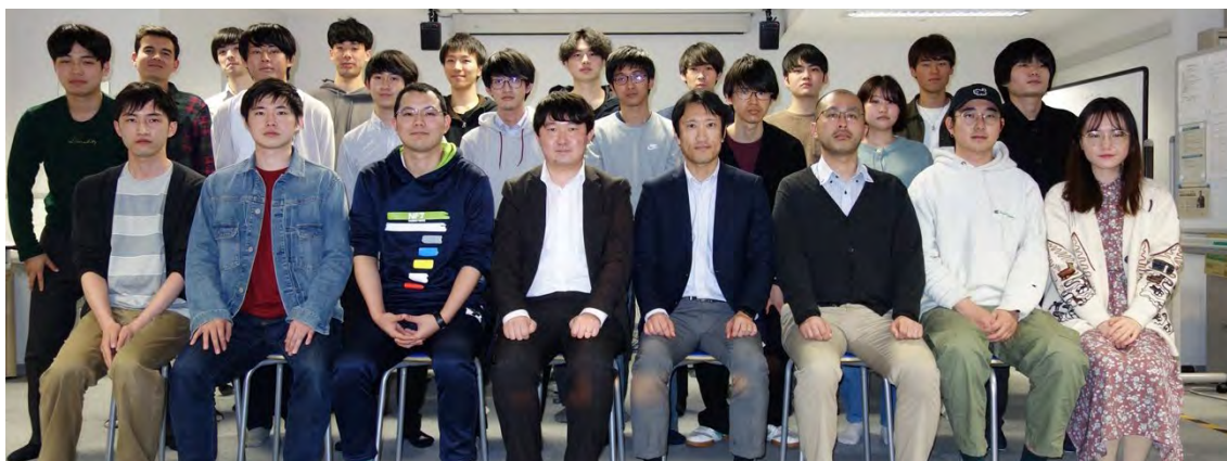
研究室メンバーの様子（2023 年 4 月撮影）

URL : https://www.ist.hokudai.ac.jp/labo/photronics/