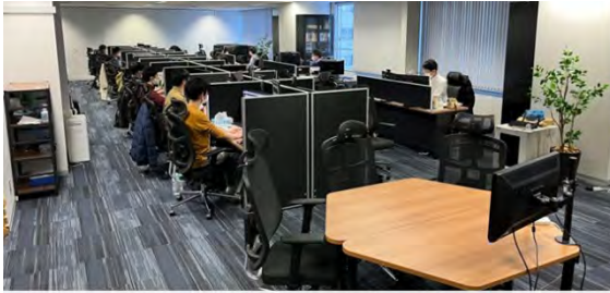
メディアダイナミクス研究室 ラボスペース